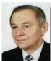
Przewodniczący - Józef Wiaderny Przewodniczący Ogólnopolskiego Porozumienia Związków Zawodowych